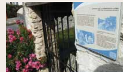
Lavoir de la Grenouillère

d'améliorer le confort, nombre de lavoirs seront couverts (protégeant de la pluie et du soleil) et fermés sur les côtés (à l'abri du vent). Sans utilité domestique aujourd'hui, il reste heureusement des passionnés pour restaurer et entretenir ces éléments remarquables du patrimoine rural.