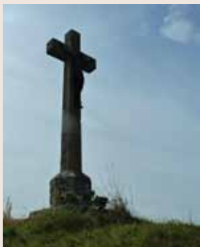
Croix du Murger