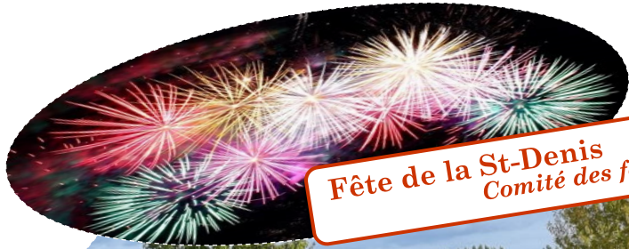
Fête de la St-Denis 1,2,3 octobre Comité des fêtes