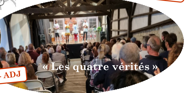
« Les quatre vérités »