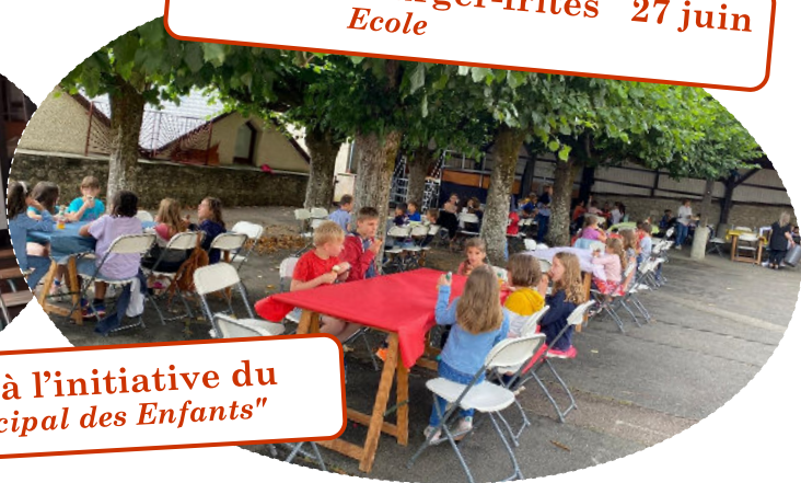
Evènements à l'initiative du "Conseil Municipal des Enfants"