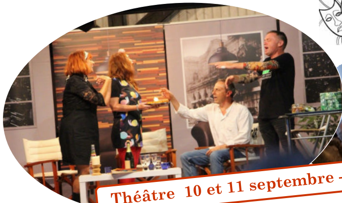
Théâtre 10 et 11 septembre - ADJ