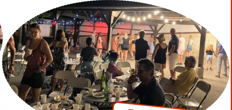
Bal du 14 juillet Comité des fêtes