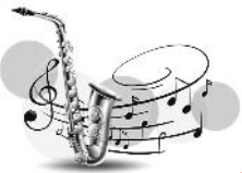
Fête de la musique 25 juin Comité des fêtes