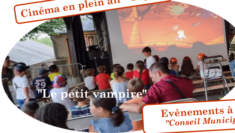
"Le petit vampire"