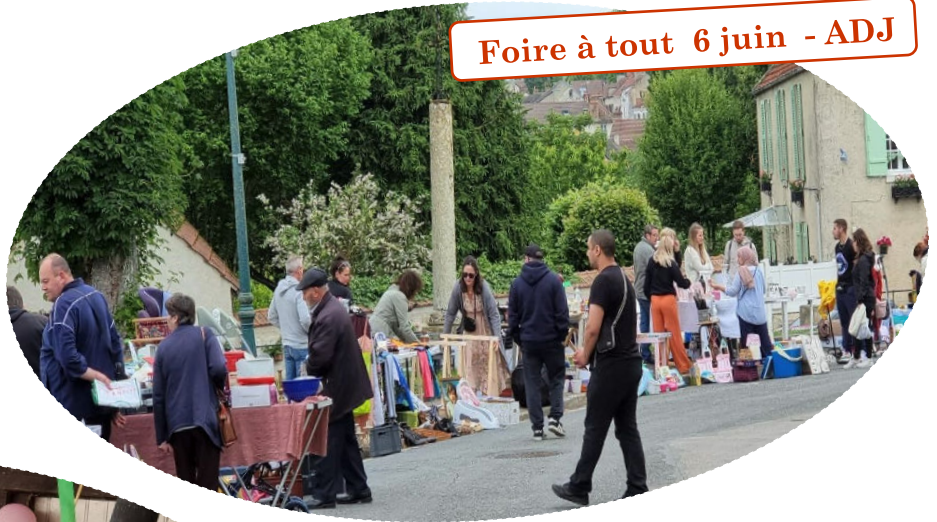
Foire à tout 6 juin - ADJ