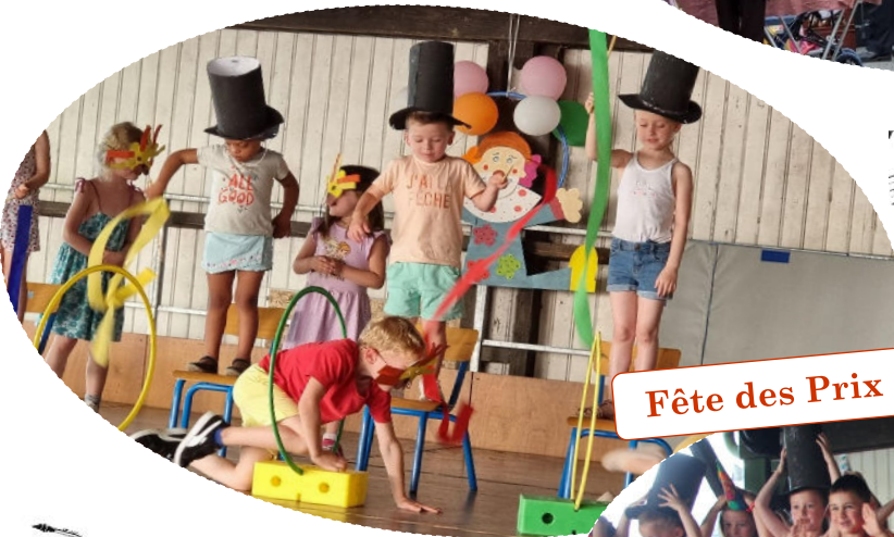
Fête des Prix 17 juin - Ecole