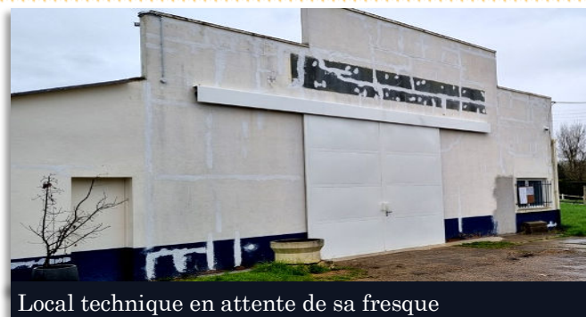
Local technique en attente de sa fresque

Ainsi pour l'édition 2024, la Communauté Urbaine a sélectionné 10 communes dont Fontenay-Saint-Père .