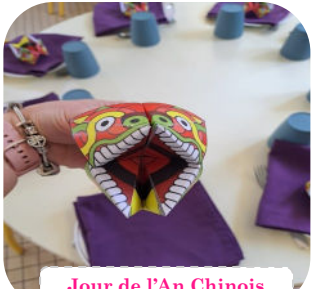
Jour de l'An Chinois Périscoplaire