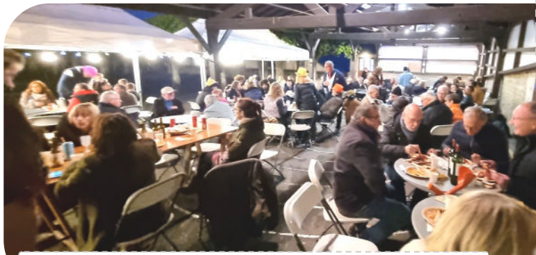
Instant de Partage-26 Avril- Comité des Fêtes et les Jazzies

pas aux saveurs des îles qui a réchauffé les cœurs et les corps. Belle ambiance, grâce à Éric-super-DJ, les années 80 étaient au RDV !