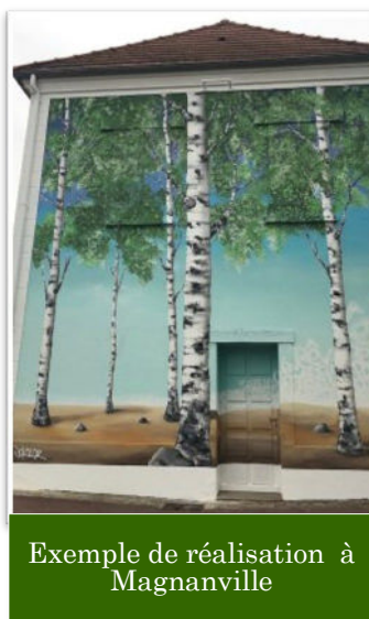
Exemple de réalisation à Magnanville

UN BEAU PROJET CULTUREL ET ENVIRONNEMENTAL POUR NOTRE VILLAGE