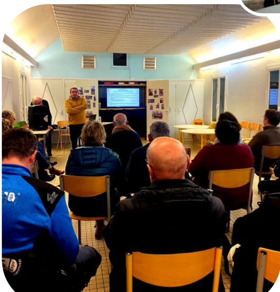
Réunion publique à mi-mandat : 9 février