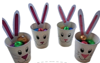
Chocolats déposés par le Lapin pour les enfants du Péricolaire !