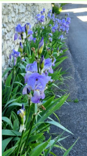
Plantation d'Iris rue du Saussaye

Le travail ne manque pas pour mettre en valeur notre village remarquable !(Prix qui nous a été attribué par Villes et Villages Fleuris).