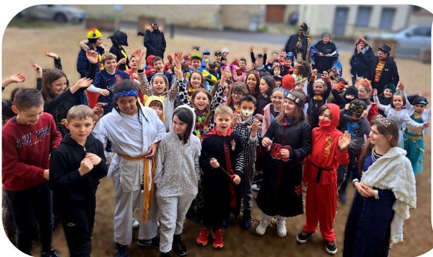
Carnaval des enfants de l'école et du périscolaire -5 mars