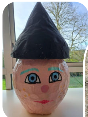
Tête de M. Carnaval réalisée par les enfants du Périscoplaire