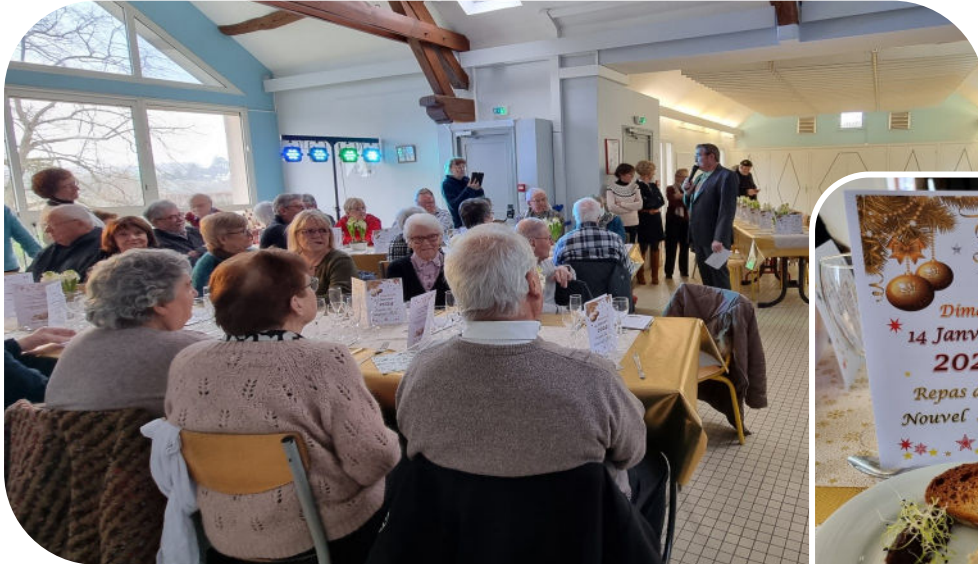
Repas des anciens-14 janvier