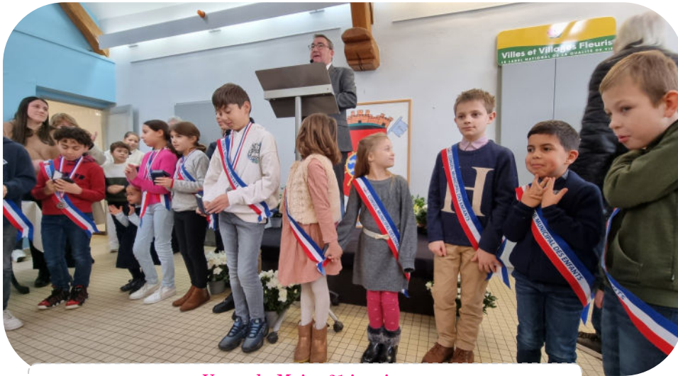
Vœux du Maire-21 janvier Présentation du nouveau Conseil Municipal des Enfants. Remise de la médaille du Village du Conseil Municipal des Enfants