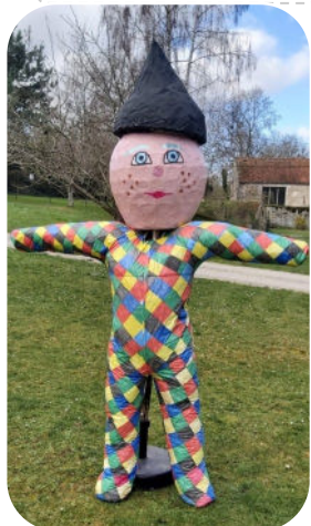
M. Carnaval 2024