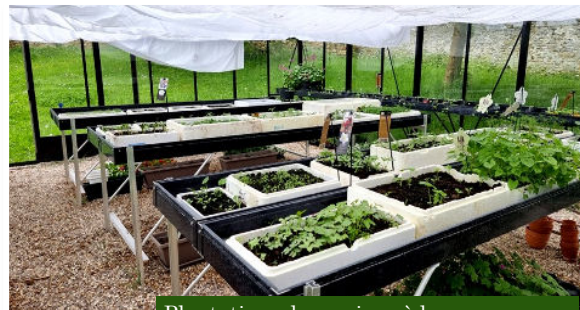
Plantations des graines à la serre. Bientôt des belles fleurs pour le village !

VOTRE aide nous est précieuse ! Continuons tous ensemble d'embellir notre village!