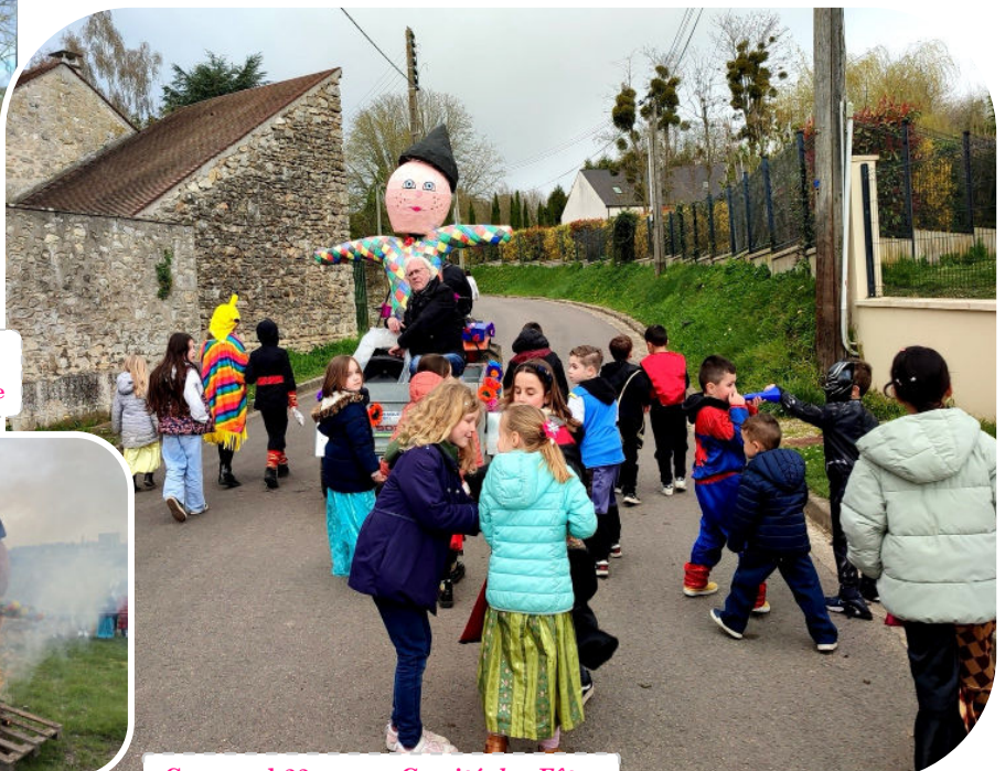
Carnaval-23 mars Comité des Fêtes