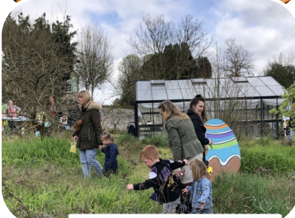
Chasse aux œufs-30 mars ADJ