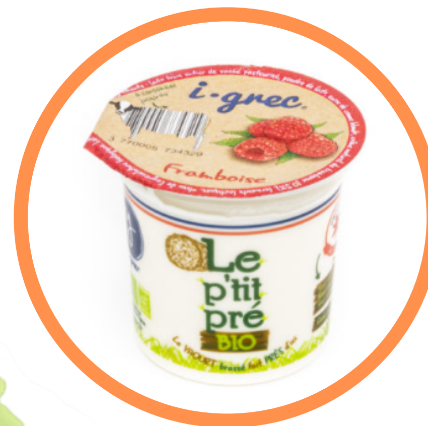
Yaourt BIO arôme framboise local et circuit court I Grec