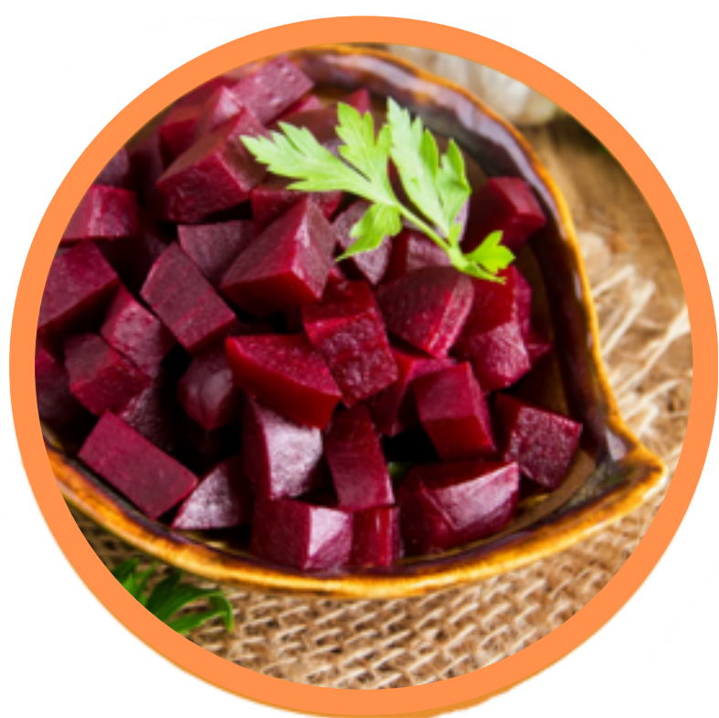
Betteraves BIO vinaigrette locales et circuit court BTG