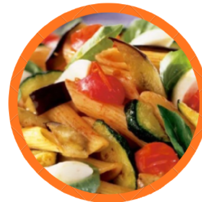
Pâtes BIO locales ratatouille et emmental râpé Atelier CQFD