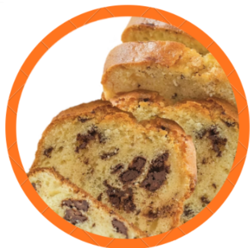
Cake pépites chocolat saveur vanille local et circuit court Biscuiterie Erté

Découvrez notre menu local, élaboré avec des ingrédients frais et provenant de producteurs régionaux :